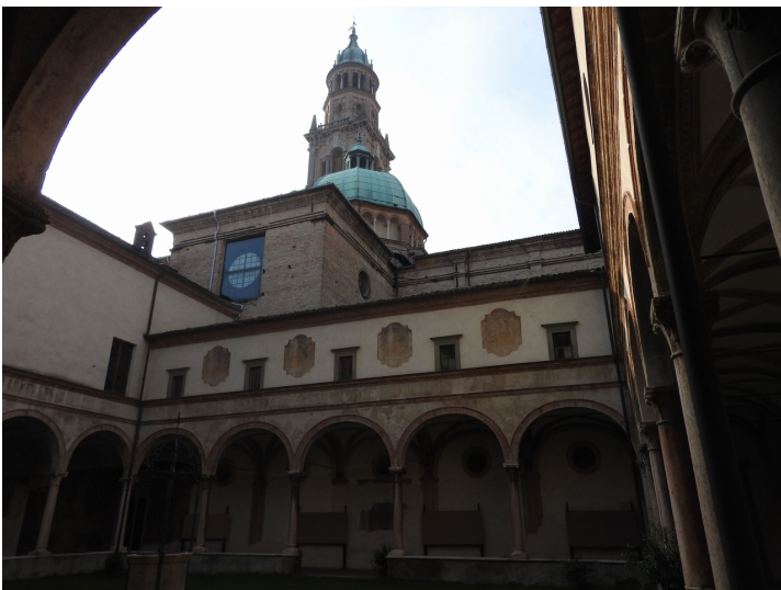
コレッジョの作品が残るパルマの修道院

美術史学研究では、自分の目で作品を見るという経験が何よりも重視されます。そのため、私たちの専攻では、隔週に一度のペースで近隣の美術館や博物館を訪れて展覧会を見に行く授業があるほか、年に1、2回、京都や奈良をはじめ、遠方の神社や仏閣、美術館にも、授業の一環として見学に訪れます。